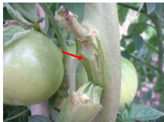
Montevideo.