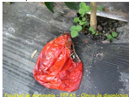
Facultad de Agronomía - EEFAS - Clínica de diagnóstico